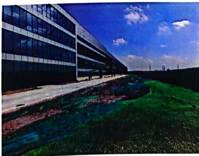
整改后：环境已整理、裸土已覆盖