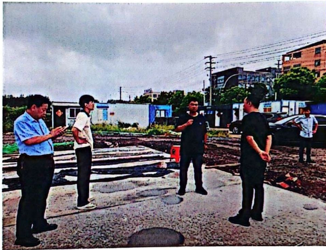
区建管部会同市安监站督查现场整改工作落实情况