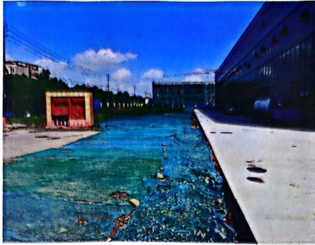
整改后：环境已整理、裸土已覆盖