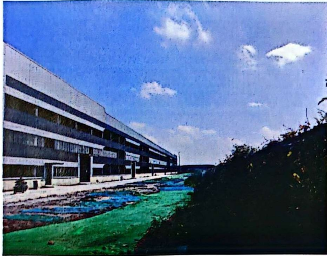
整改后：喷淋保持开启